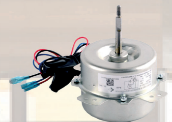
Nuolatinės srovės DC ventiliatoriaus variklis su dažnio keitikliu