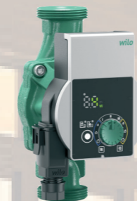
Tylus ir ekonomišką aukšto efektyvumo A klasės cirkuliacinis siurblys